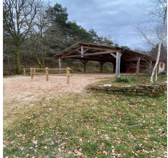
La halle de l'étang de la Chèze