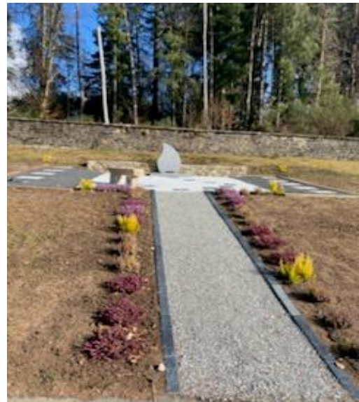
Le jardin du souvenir