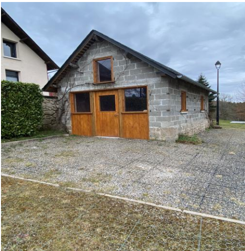
Le bâtiment sur le parking de la Mairie