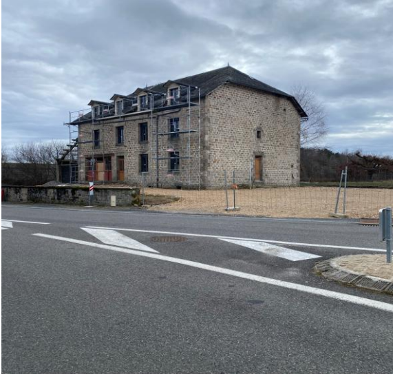
Les travaux de rénovation du futur Multiservices