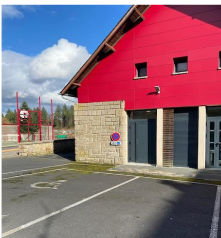
Les toilettes publiques à côté du city stade